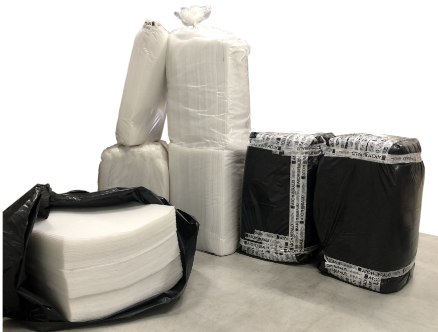
Photo de préparation d'une commande annuelle de filtres à expédier chez un client.

Nous couvrons aujourd'hui la plupart des besoins en référence filtres (du G2 au G5), pour dimension standard constructeur